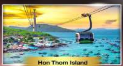
Hon Thom Island