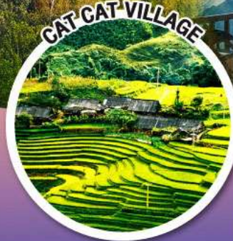
CAT CAT VILLAGE