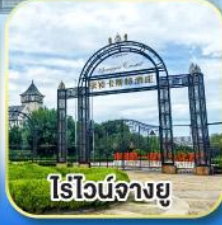
ไร์ไวน์จางยู