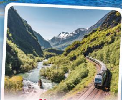
พหลิมส์บานา รถไฟเส้นทางสายโรเมนติก