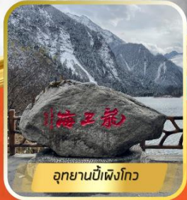
อุทยานปี้เฉิงโกว