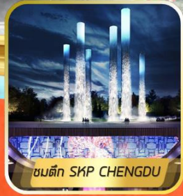
ชมตึก SKP CHENGDU