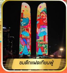
ชมตึกแพดเทียนฟู