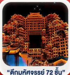
"ตึกมหัศจรรย์ 72 ชั้น"