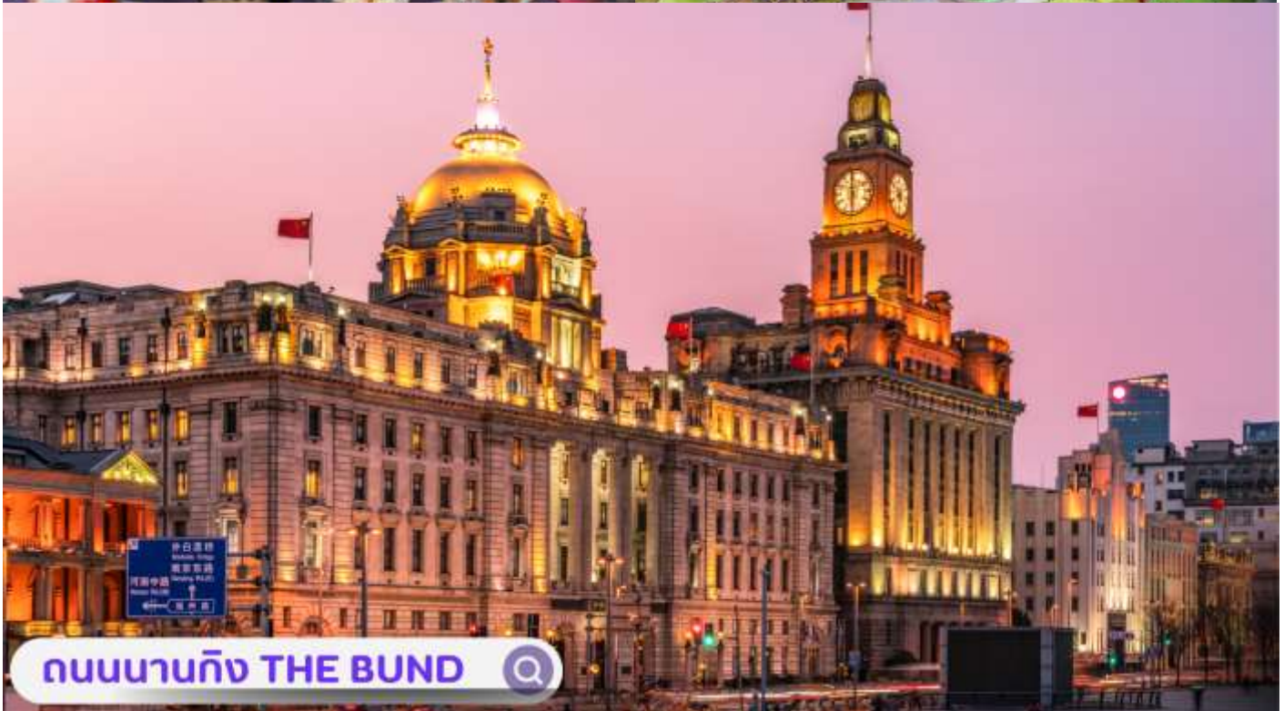
ถนนนานกิง THE BUND

จากนั้นอิสระท่านเพลิดเพลินที่ ถนนนานจิง(NANJING ROAD) เป็นย่านช้อปปิ้งเก่าแก่ที่สุดของเซี่ยงไฮ้ เป็นตลาดซื้อขายของกันคึกคักตั้งแต่ทศวรรษ 1920 ตั้งอยู่ฝั่งผู้ซิกินพื้นที่ยาวตั้งแต่ฝั่งตะวันตกของ “เดอะ บันด์” ถึง “พีเพิลส์