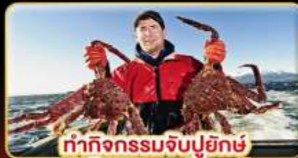
ทำกิจกรรมจับปูยักษ์ “พร้อมเมนูสุดพิเศษ”