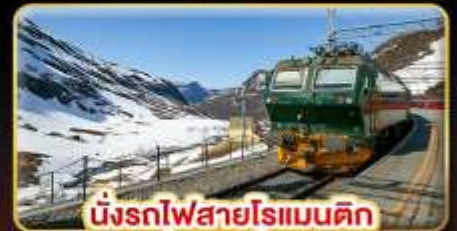
นั่งรถไฟสายโรแมนติก “พร้อมสปา”