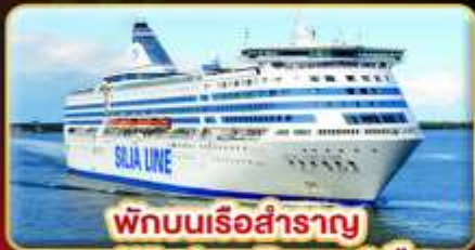
พักบนเรือสำราญ แบบ Window Room 2 คืน