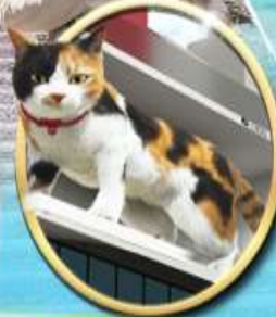
ฮิมะซัง ฮิมะซัง