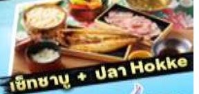
เซ็ทซาซุ + ปลา Hokke

36,919 ราคา เริ่มต้น บาท รวมภาษีมูลค่าเพิ่ม 7%