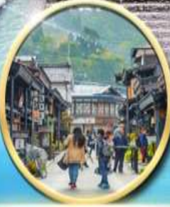
เมืองเก่า ทากายามา