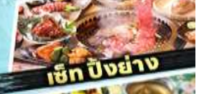
เซ็ท ฮิมะซัง