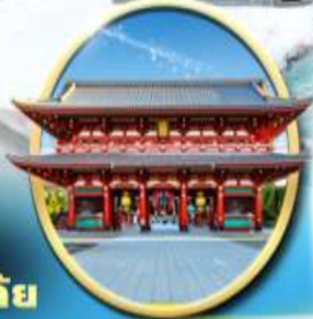
วัด เซ็นโซจิ

ถนนช้อปปิ้ง ฮิมะซัง ตลาดออนเซ็นโฮม ตลาดเช้า ภูเขาทาว ถนนฮิมะซังฮิลล์ สะพานทากายามิ