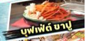
บุฟเฟ่ต์ ซาซุ