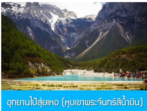
อุทยานปี่สุ่ยเหอ (หุบเขาพระจันทร์สีน้ำเงิน)

หมายเหตุ กรณีที่กระเช้าใหญ่ขึ้นภูเขาหิมะมังกรหยกปิดให้บริการ ด้วยเหตุที่สภาพอากาศไม่เอื้ออำนวย หรือเป็นการปิดเพื่อตรวจสอบสภาพและซ่อมแซมประจำปี ทางทัวร์ขอสงวนสิทธิ์ที่จะจัดโปรแกรมขึ้นกระเช้า ที่จุดชมวิวภูเขาหิมะมังกรหยก ณ สถานีกระเช้าหุยนซานผิง แทน