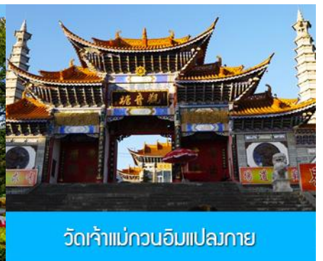
วัดเจ้าแม่กวนอิมแปลงกาย