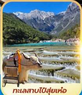
ทะเลสาบโป๋สุ่ยเหอ