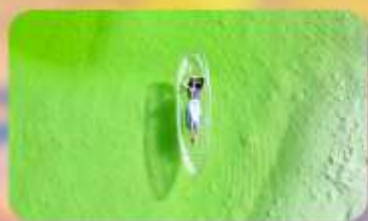
ทะเลสาบเกลือดาเอ๋อร์ซัน