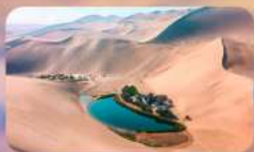
เหมินทรายหมิงซาซาน