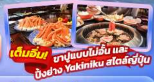
เต็มอิ่ม ชาบูแบบไม้อื่น และ ปิ้งย่าง Yakiniku สดร้อนญี่ปุ่น

Highlight สัมผัสความเป็นญี่ปุ่น ชมวิวฟูจิที่ ทะเลสาบยามานาทะเลสาบ ศาลเจ้าฟูจิซังเซเนงน "Unseen" ขอบพระด้วยหัวไชเท้า ที่วัดมัตสึจิยามา ไซเดิน ถ่ายภาพวิวไร่ชาที่ โอบุจิ ชะชะบะ ขอบพระ วัดอาซากุสะ วัดพระโศภิตคุ โดบุทสึ เดินเล่น คาวาโกะเอะ Toyosu Senkyaku Banrai ซอปปิงย่านชินจูกุ และห้างไดเวอร์ซิตี