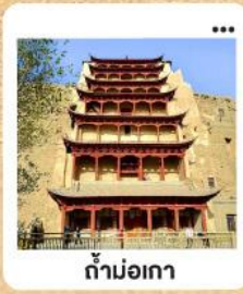
ต้าม่อเกา