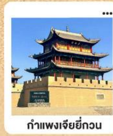
กำแพงเจียชี่กวน