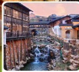
เมืองโบราณเหย่าหู