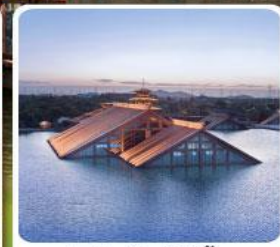
พิพิธภัณฑ์ไดโนเสาร์กวางตุ้ง