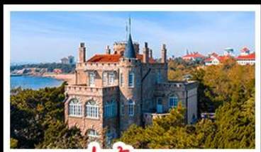
ป่าตึกวน

พระราชวังฤดูร้อน - วิวเมืองซิงเต่า รถไฟความเร็วสูง - ภูเขาเหลาซาน กำแพงเมืองจีนด่านจวิยงกวน - ป่าตึกวน พักโรงแรมระดับ 4 ดาว - ไม่หลงร้านช้อปปิ้ง มือพิเศษ เปิดปักกิ่ง , หม้อไฟซีฟู้ด