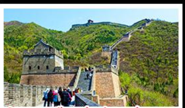
กำแพงเมืองจีนด่านจวิยงกวน