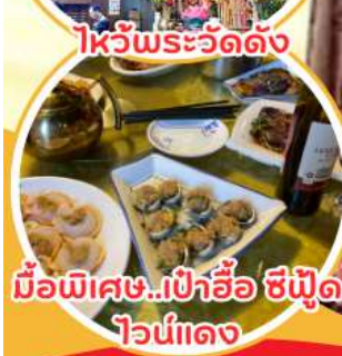
มือพิเศษ...เป่าอ้อ ซีฟูด ไวน์แดง