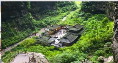
อุทยานแห่งชาติบ่อหลุมฟ้า

*ทางบริษัทฯ ขอสงวนสิทธิ์ในการสลับโปรแกรมทัวร์ตามความเหมาะสมขึ้นอยู่กับสถานการณ์หน้างาน โดยคำนึงถึงผลประโยชน์ของลูกค้าเป็นสำคัญ