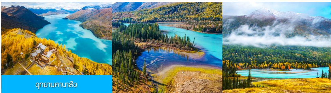
อุทยานคานาสีอ