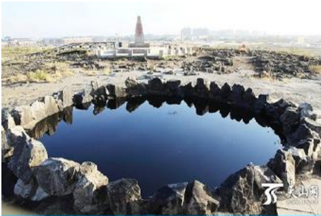
บ่อน้ำมันสีดำ

ระหว่างทางแวะรับประทานอาหารกลางวัน ณ ภัตตาคาร (11)