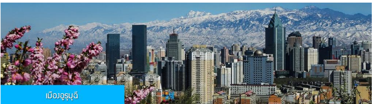
เมืองอูรูมูดี

พักที่ MERCURE HOTEL โรงแรมระดับ 4 ดาวท้องถิ่นหรือเทียบเท่าในเมืองวูรูมูดี