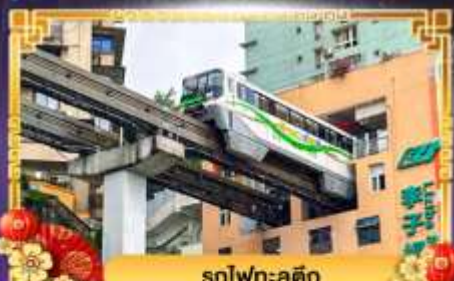
รถไฟฟ้า-ลุดัก