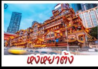
แสงเขยาดัง

อุทยานหุบหม่นบ่อฟ้า - อุทยานเขานางฟ้า หงหยาดัง - นั่งรถไฟทะเลสาบ - อุทยานสี่ดรุณี ปี่ฝิงโกว - สะพานหนานเฉียว