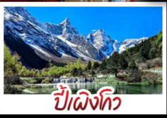
ปี่ฝิงโกว