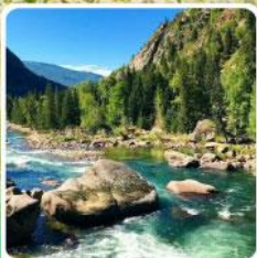
อุทยานเคอเคอทังไห่