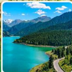
อุทยานเทียนชาน เทียนฉือ