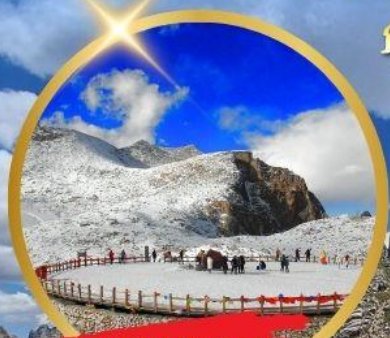
OPTIONAL TOUR ธารน้ำแข็งท่ากู่ปิงชวน