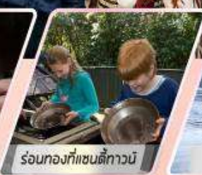
ร้อนท้องที่แซนดีทาวน์