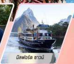
มิสฟอร์ด ซาวน์