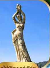
จูไห่ฟิชชอร์ทิสรา