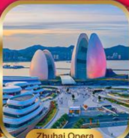
Zhuhai Opera House