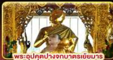
พระอุคุตปางจกบาตริเยียมาร