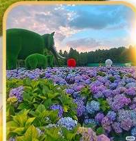
ดอกไม้ตามฤดูทงกา