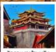
วัดสามะชงจ้านหลิง