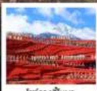
โชว์จางอีหนว

เมืองโบราณต้าหลี่ / เจดีย์สามองค์ / ไค้งริ / ภูเขาสานอ้อไห่ / เมืองโบราณแซงกรีล่า / ซองแทนเสือกะโถด (รวมมินโถเค็อนซัน-คง) / วัดสามะชงจ้านหลิง (รวมท่ารถขึ้น-ลง) ชมวิวยามค่ำกินเมืองโบราณลี้เจียง / ภูเขาหิมะมังกรหยก (มังกรช่าไห่ทง) / หุบเขาพระจันทร์สีน้ำเงิน ไม้ศุ่ยเหอ (รวมรถกอล์ฟ) / โชว์จางอีหนว / เมืองโบราณไปซา นั่งรถไฟชมวิวรอบภูเขาหิมะมังกรหยก / ละครมังกรดำ / คาเฟ่ไว้นดื่ม YUN DI AN CAFE (รวมค่าเครื่องดื่ม) / เมืองโบราณลี้เจียง / ถนนคนเดินจินนี่ตู้