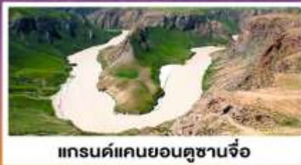
แกรนด์แคนยอนดูซานจื่อ