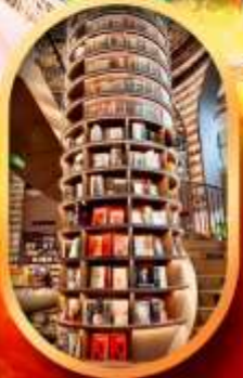
อุทยานปีเหมิงโกว