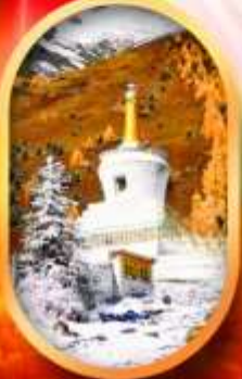
อุทยานสีครุณี