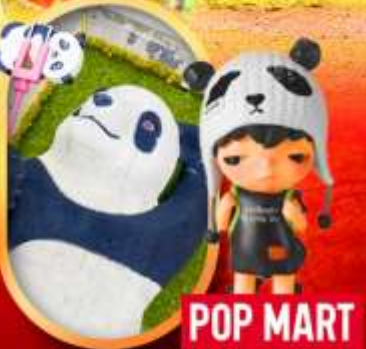
หมีแพนด้าเซลฟี