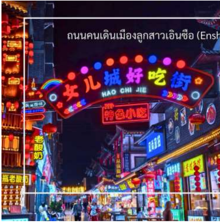
ถนนคนเดินเมืองลูกสาวเินซือ (Enshi Daughter City Pedestrian Street)