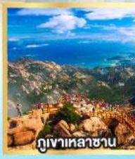
กุเขาเหลาซาน