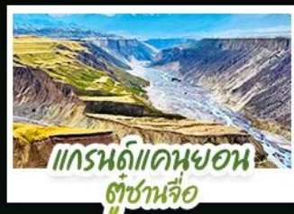
แกรนด์แคนยอน สู่ซ่านหลือ

ปล่อยให้ตัวเองลอยไปกับสายลมเย็นบนที่ราบสูง...ในดินแดนที่ความโรแมนติก เบ่งบานท่ามกลางทุ่งหญ้าและหิมะ สัมผัสความเขียวจีของ "ทุ่งหญ้านาเลทิ" และ "ทุ่งหญ้าคาสาจิน" ที่ได้รับการยกย่องว่าเป็นทุ่งหญ้าที่สวยงามที่สุดแห่งหนึ่งของโลก ชมความใสสะอาดของ "ทะเลสาบไซ่หลี่บู๋" น้ำตาดียศสุดท้ายของมหาสมุทรแอตแลนติก ที่สะท้อนภาพภูเขาหิมะอย่างงดงาม