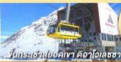
ขึ้นกระเช้าสู่ยอดเขา คีอาไวเลซซา