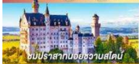
ชมปราสาทน้อยชวานสไตน์