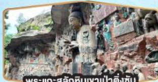
พระแกะสลักหินงาป่าตั้งชัน