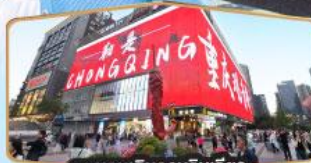
ถนนคนเดินถวณอันเฉียว