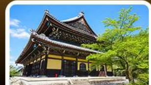
วัดนัมเซ็นจิ