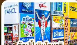
ช้อปปิ้งชินโซบาชิ และโดตงโมริ