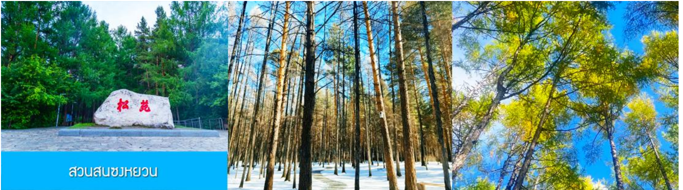
สวนสนขงหยวน

เช้า รับประทานอาหารเช้า ณ ห้องอาหารของโรงแรม (22)