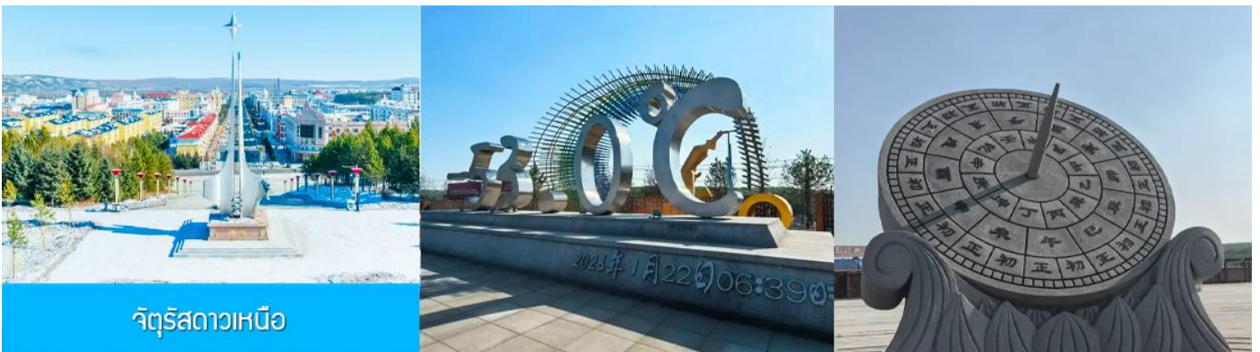
จัตุรัสดาวเหนือ