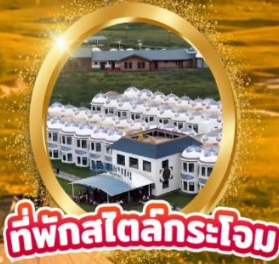
ที่พักสไตล์กระโจม