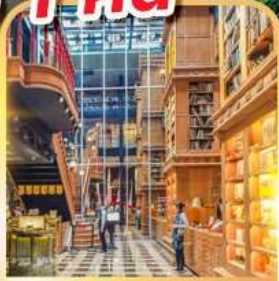
ร้านไอศกรีมมियाฮาร่า