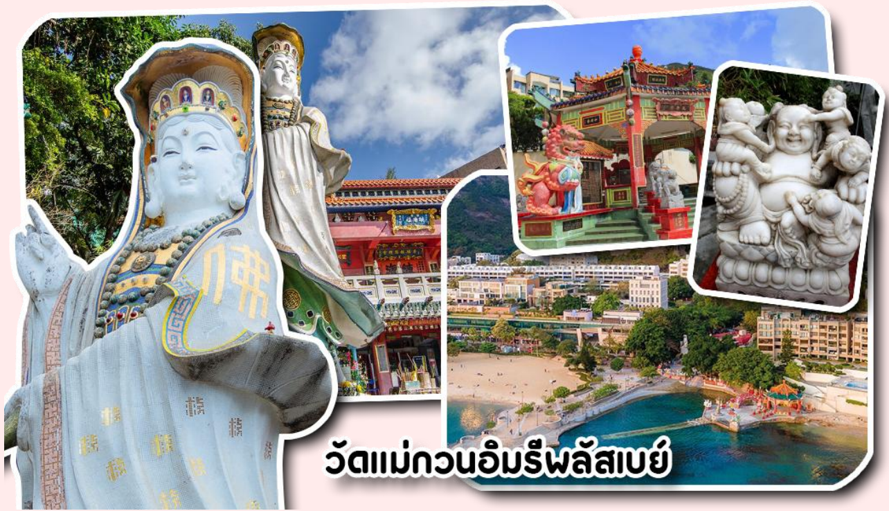
วัดแม่กวนอิมรีพลูเอ๋ย

อยากได้ลูกสาวให้ลู่บ่ท้องขวา ถัดมาคือ เจ้าแม่ทับทิมเทพีแห่งท้องทะเล ท่านจะคอยคุ้มครองผู้เดินทางทางเรือ หรือผู้ที่เดินทางไปไหนมาไหนท่านจะคอยคุ้มครองให้ปลอดภัย และมีโชคลาภ ถัดจากบริเวณที่กราบไหว้ขอพร ก็จะมีศาลาแปดเหลี่ยมริมน้ำ และสะพานเล็กๆ ที่ชื่อว่าสะพานต่ออายุ ซึ่งเชื่อกันว่าหากเดินข้ามสะพานแห่งนี้ 1 ครั้ง ก็จะมีอายุยืนขึ้น 3 ปี