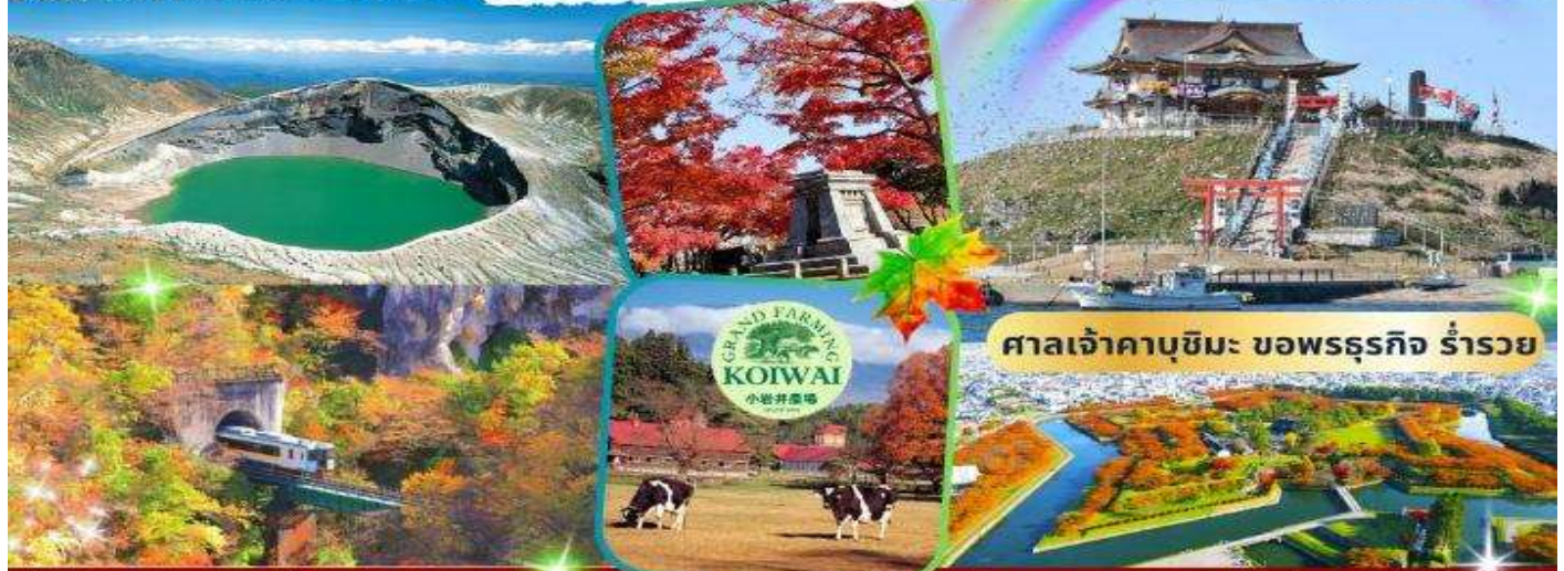
ศาลเจ้าคาบูชิมะ ขอพรธรรกิจ ร่ำรวย

Japan เที่ยว 2 เกาะ!! ชมใบไม้เปลี่ยนสี เที่ยวสบาย ฤดูฮัลโหล ช้อปปิ้งครบ