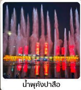
น้ำพุคังปาสือ