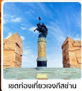
เขตท่องเที่ยวเจงกิสข่าน