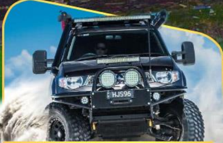
ขึ้นรถ 4WD สู้อีกกลางเทือกเขาคอเคซัส