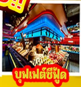
บุฟเฟ่ต์ซีฟู้ด