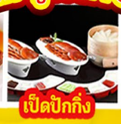
เปิดปีกกึ่ง