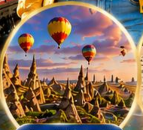
เมืองคปปาโดเกีย Cappadocia