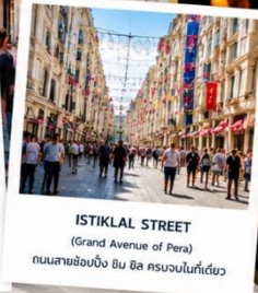
ISTIKLAL STREET (Grand Avenue of Pera) ถนนสายช้อปปิ้ง ยืน อิล ครบวงในทีเดียว