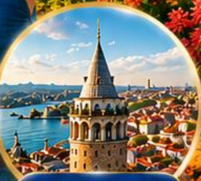
หอคอยกาลาตา Galata Tower