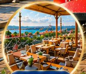
Seven Hills Cafe ชมวิว อิสตันบูล