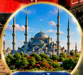
สุเหร่าสีน้ำเงิน Blue Mosque