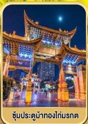
ซุ้มประตูม้าทองไถ่มรดก