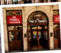
สถานีตุเนล (TUNEL STATION) สถานีรถไฟใต้ดินสายเก่าแก่และเป็นหนึ่งในระบบขนส่งที่เก่าแก่ที่สุดในโลก