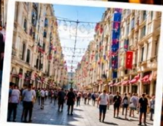
ISTIKLAL STREET (Grand Avenue of Pera) ถนนสายช้อปปิ้ง ยืน 88 ตรกม.ในทีเดียว