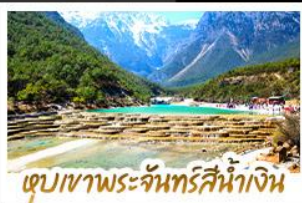
เขื่อนเขาพระจันทร์สีน้ำเงิน