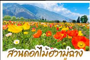
สวนดอกไม้ฮวามู่ฉาง