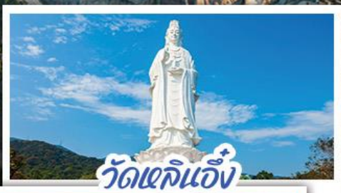
วัดเลิอัน