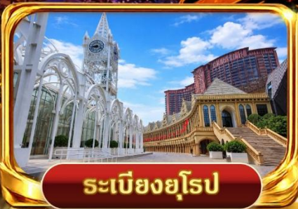
ระเบียงยุโรป